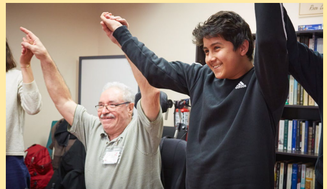
Maison des Tournesols – St-Hubert | École sec. Antoine-Brossard 2018

Pour en savoir plus: https://www.lezebrejaune.com/eveil-par-le-mouvement